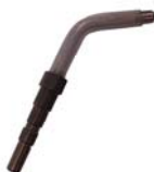
BUSE INDUSTRIELLE COUDEE A00955