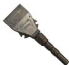
BUSE EVENTAIL INDUSTRIELLE A00956