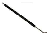
BUSE VENTILEE COUDEE 100 CM A00953