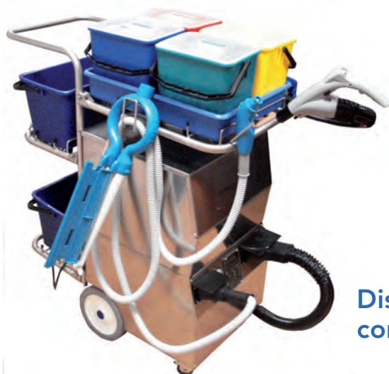
Dispositif de Désinfection Vapeur (DDV) complet